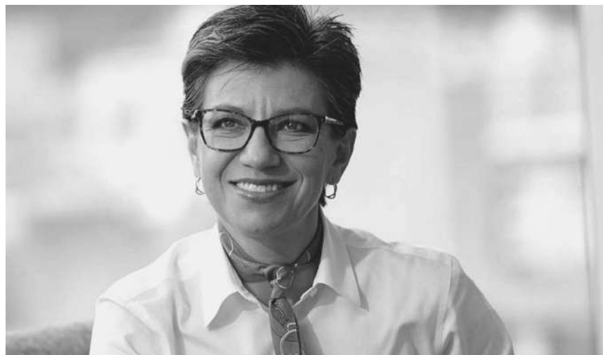
CLAUDIA LÓPEZ. ALCALDESA MAYOR DE BOGOTÁ

“ Nuestro interés es sacar esto adelante, y que este programa pueda ser parte del legado que le quede a la ciudad; en medio de la pandemia puede ser una red pública extraordinaria y un modelo territorial preventivo ”