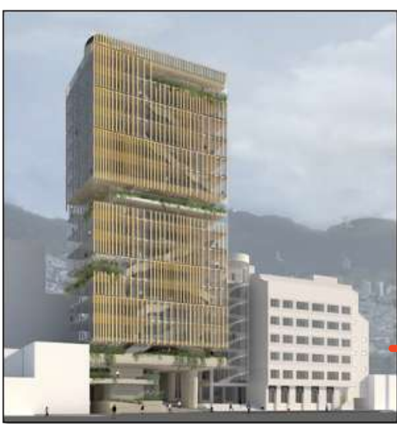
REGISTRO FOTOGRÁFICO Y RENDERS CONDICIÓN ACTUAL Y PROYECTADA EDIF. FAC. DE INGENIERÍA