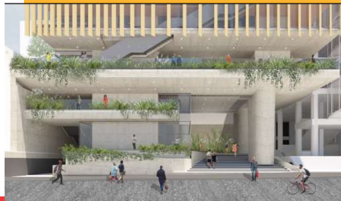
REGISTRO FOTOGRÁFICO Y RENDERS CONDICIÓN ACTUAL Y PROYECTADA EDIF. FAC. DE INGENIERÍA

En la pasada sesión ordinaria No.20, del pasado 30 de diciembre, fue aprobado el proyecto de certificación de "Construcción y dotación de mobiliario del Edificio de Laboratorios e Investigación de la Facultad de Ingeniería de la Universidad Distrital Francisco José de Caldas Bogotá", que será financiado con recursos del Sistema General de Regalías, y del Fondo de Ciencia y Tecnología.