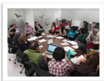
Proceso Construcción Plan Estratégico de Desarrollo.