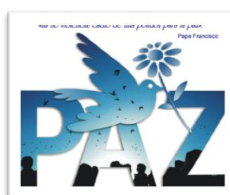
Construcción Política de Paz