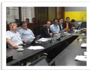
Apoyo del Consejo Superior Universitario