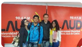
Movilidad Académica en la Universidad Distrital