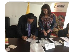
Convenios de Paz en la Universidad